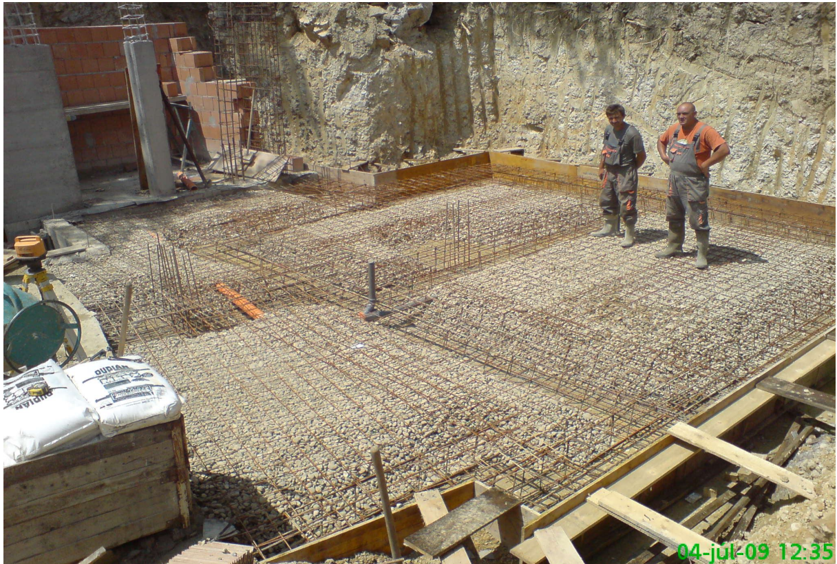
13. kép – Szerkezetépítés (kavicságypálya készítése)