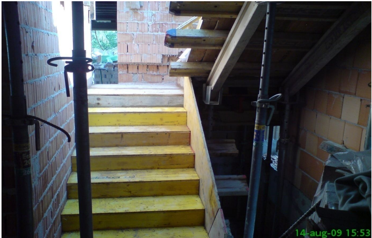
3. kép – Lépcsőzsalu