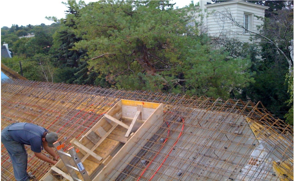
15. kép – Szerkezetépítés (betonacél szerelése)