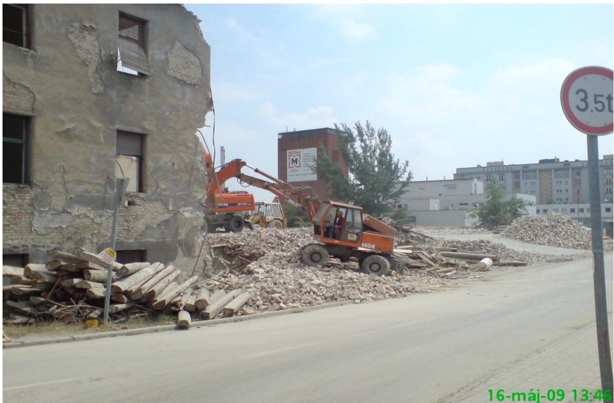
24. kép – Bontás (Dombóvári út 9-11.)