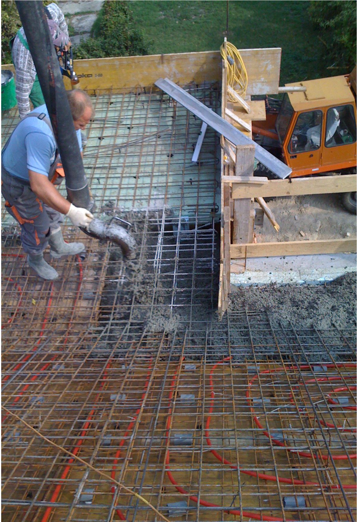
17. kép – Szerkezetépítés (betonozás)