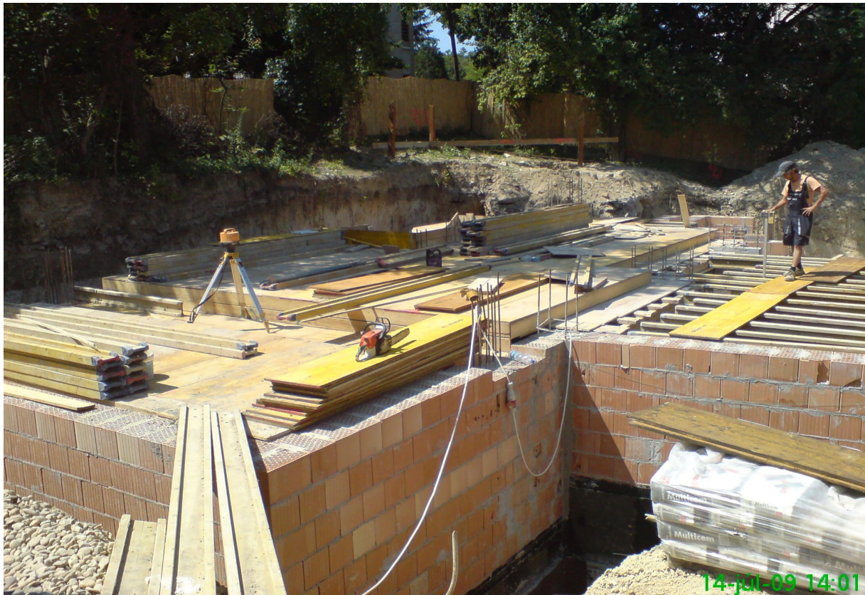
2. kép - Födémzsalu