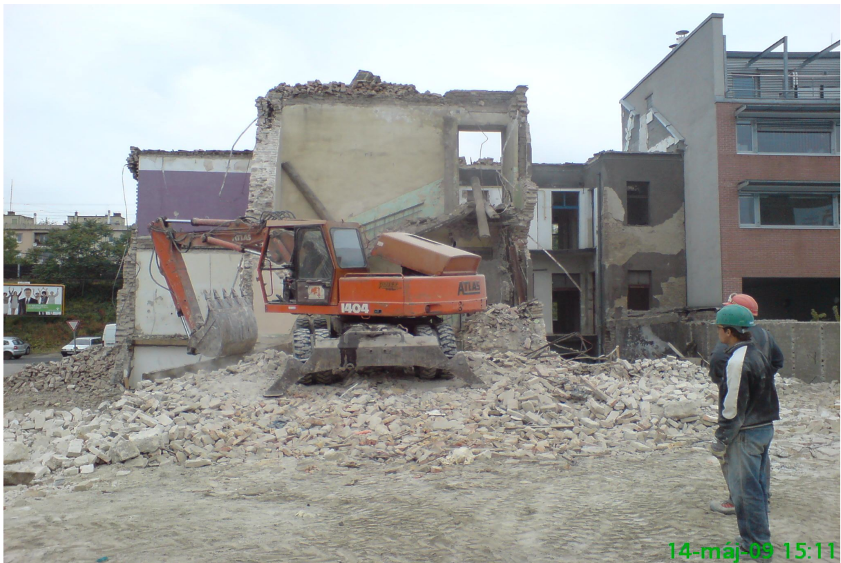
22. kép – Bontás (Dombóvári út 9-11.)