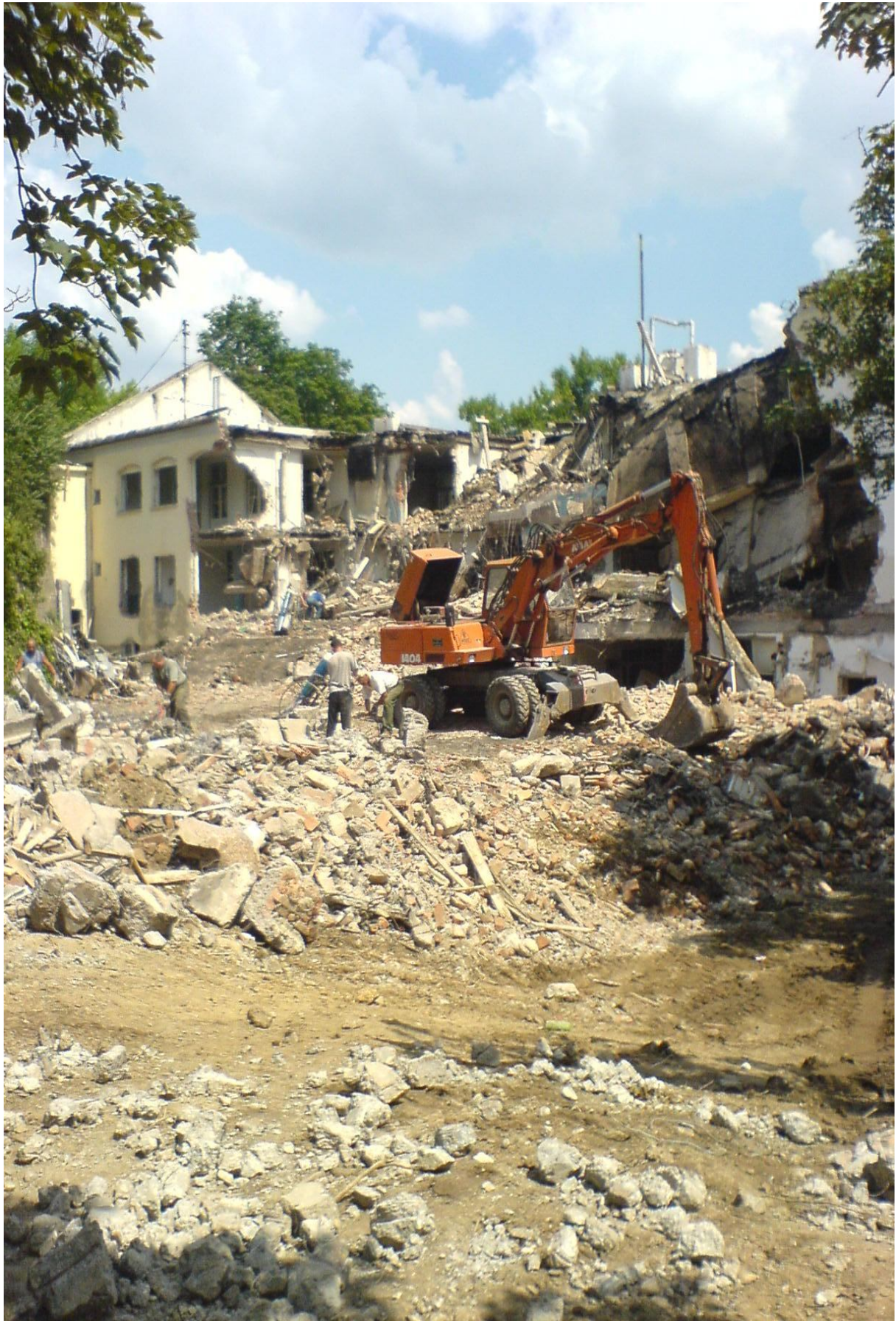
18. kép – Bontás /BM Óvoda/