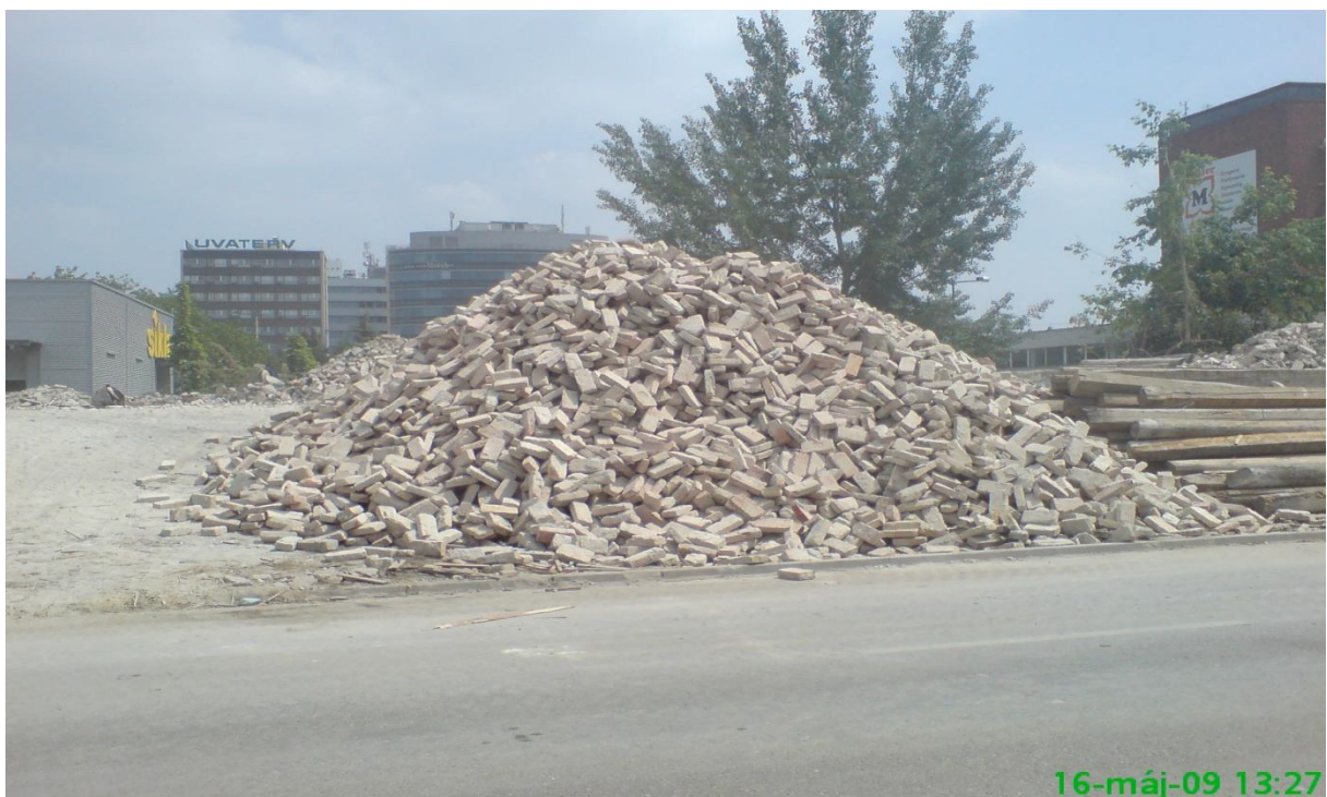
26. kép – Bontás (Dombóvári út 9-11.)