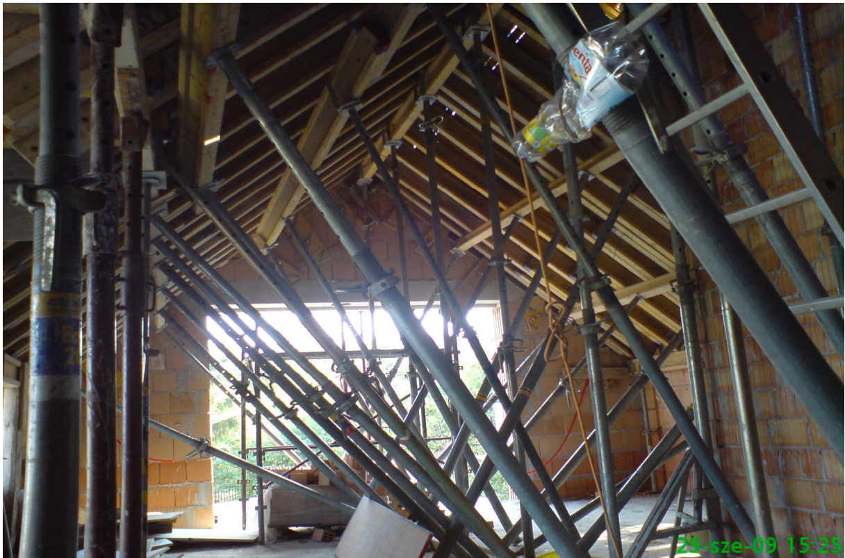
8. kép - Koporsófödém zsalu