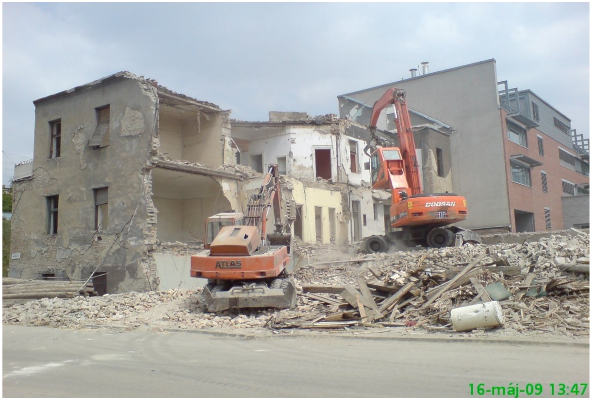
25. kép – Bontás (Dombóvári út 9-11.)