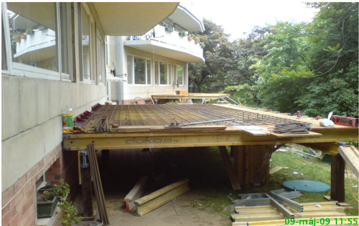
10. kép - Terasz zsalu