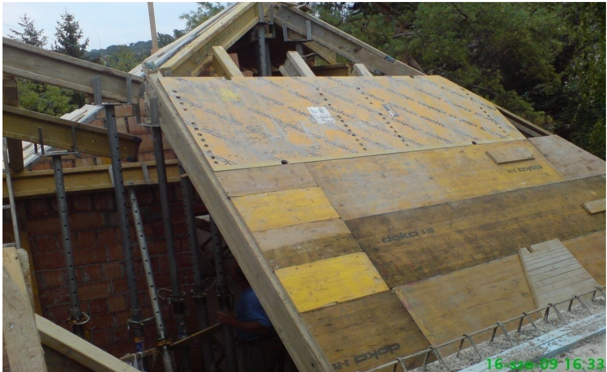
5. kép – Koporsófödém zsalu