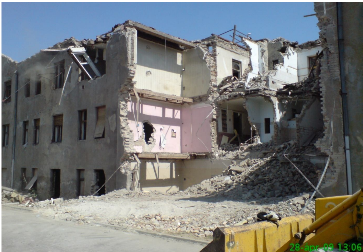
20. kép – Bontás (Dombóvári út 9-11.)