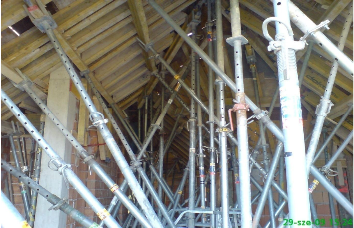
7. kép - Koporsófödém zsalu