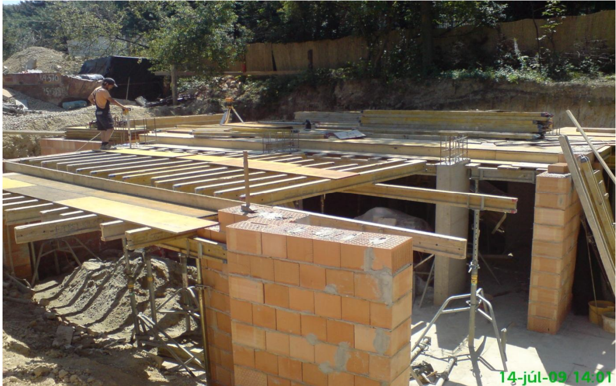
1. kép – Födémzsalu