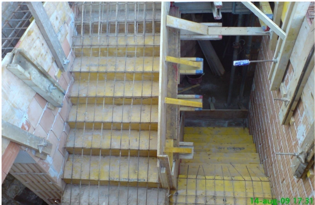
4. kép - Lépcsőzsalu