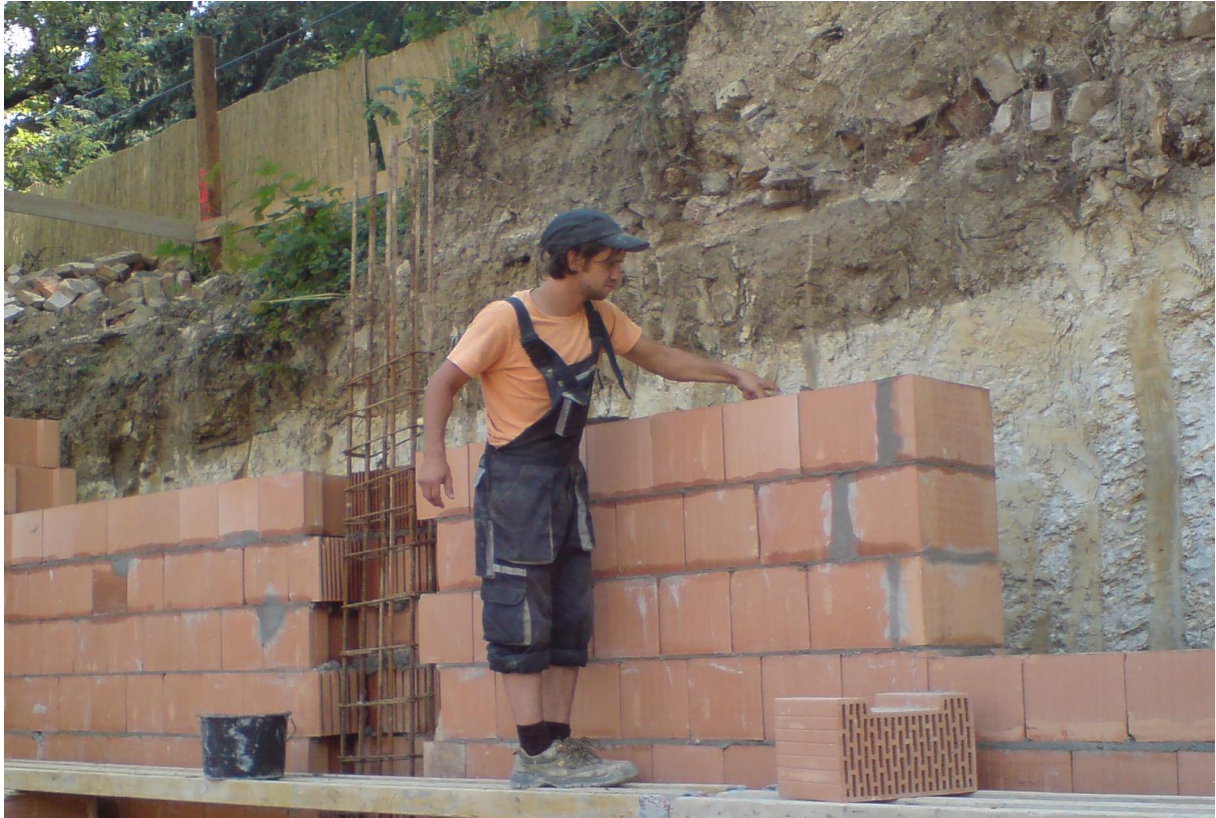
11. kép – Szerkezetépítés (falazás)