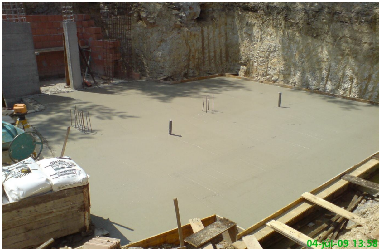
14. kép – Szerkezetépítés (betonozás)