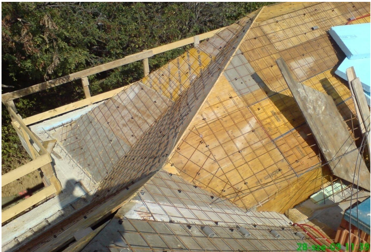
6. kép – Koporsófödém zsalu