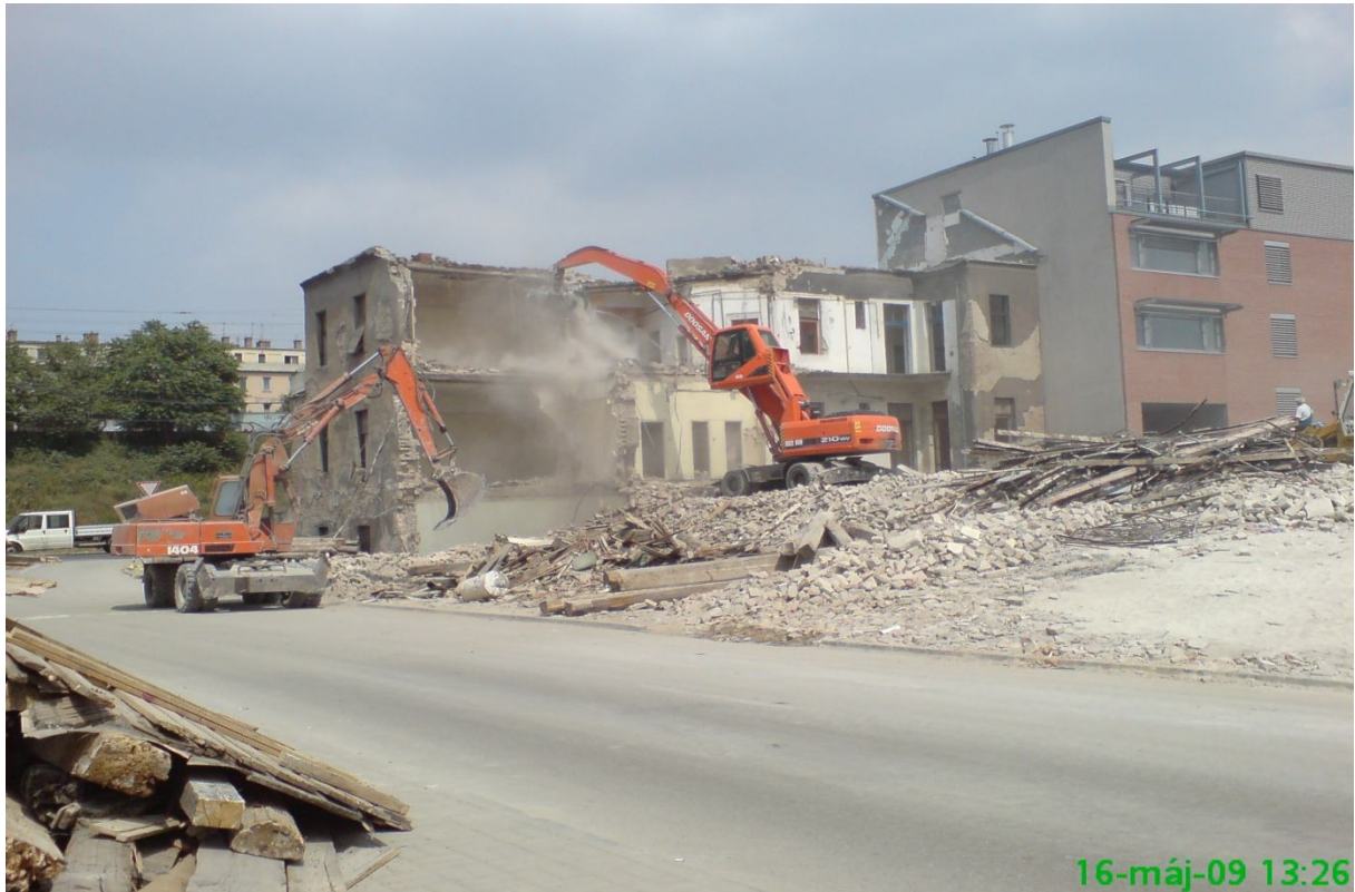
23. kép – Bontás (Dombóvári út 9-11.)