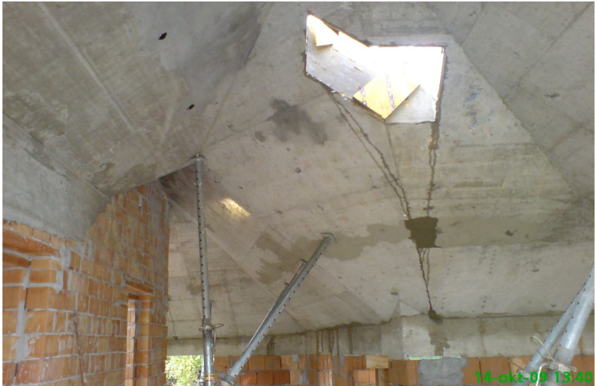
9. kép - Koporsófödém zsalu