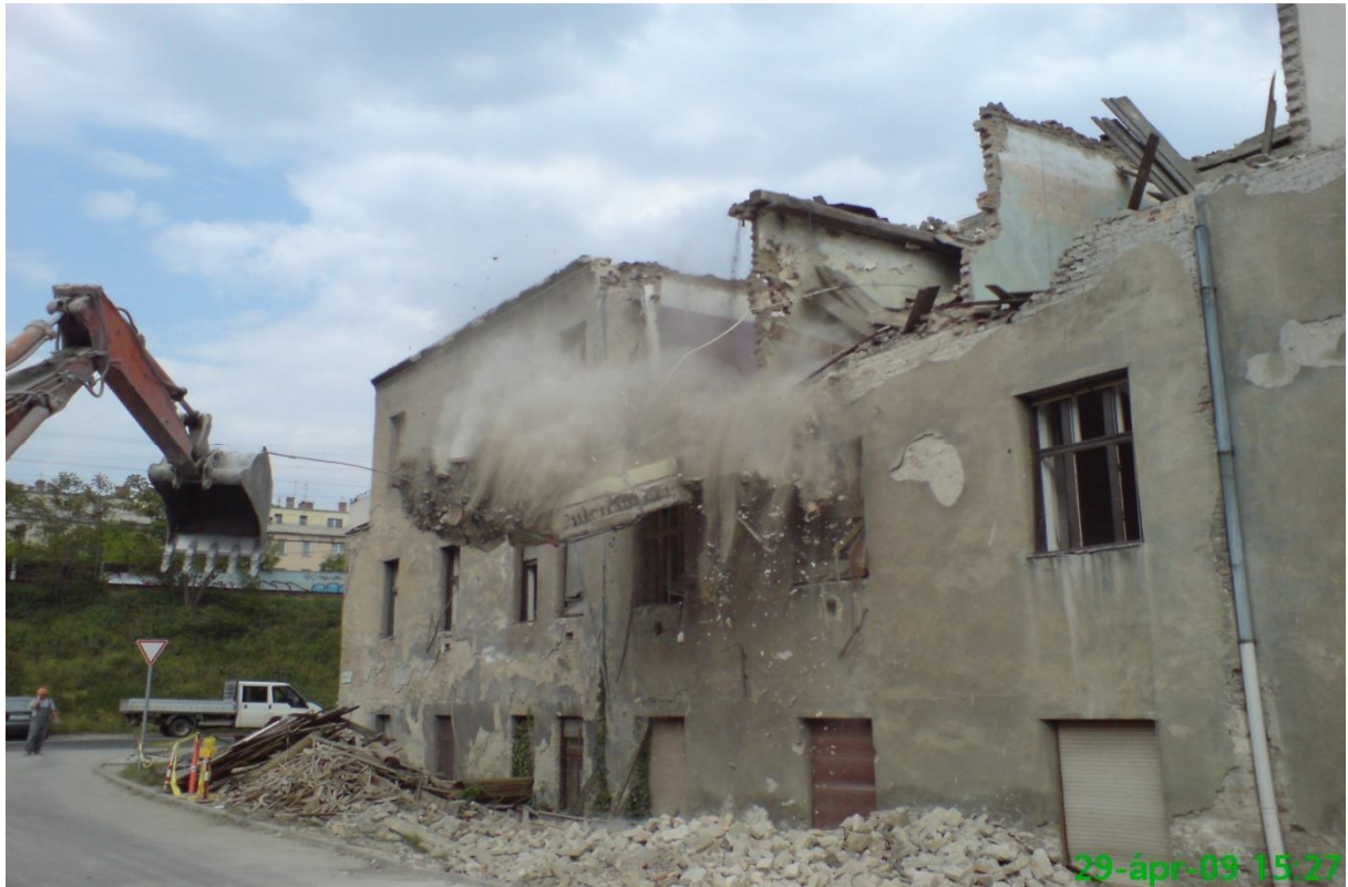
21. kép – Bontás (Dombóvári út 9-11.)