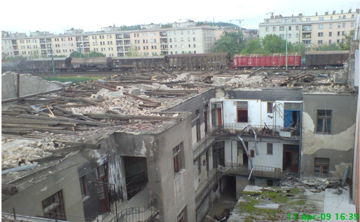
19. kép – Bontás (Dombóvári út 9-11.)