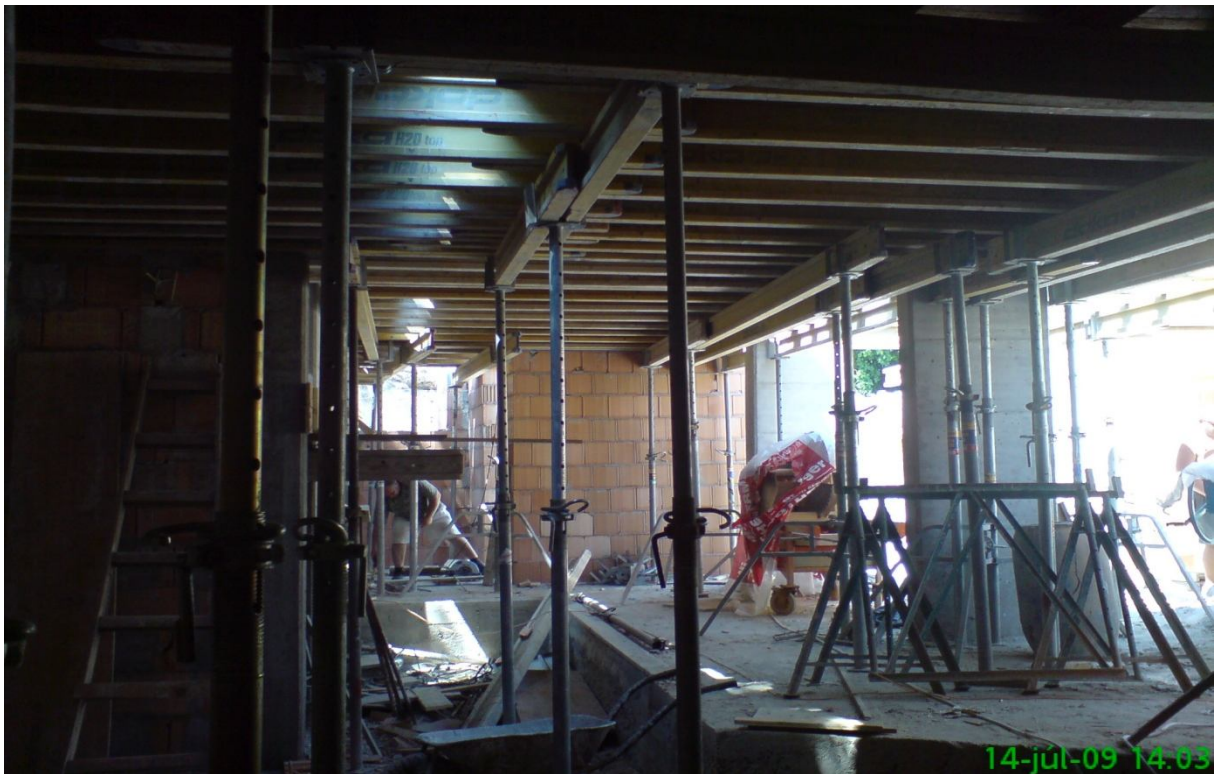
12. kép – Szerkezetépítés (vegyes)