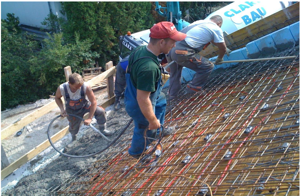
16. kép – Szerkezetépítés (betonozás)